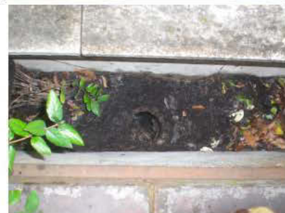
4° Pluviale troviamo a circa m. 3 sifone