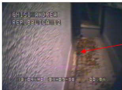
2° Pluviale non siamo riusciti a passare causa ostruzione del bocchettone