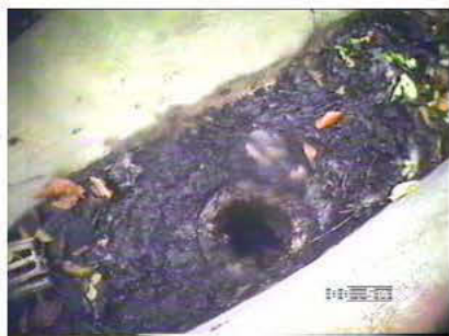
3° Pluviale troviamo a circa m. 3 sifone