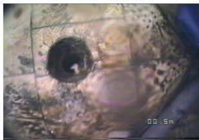
1° Pluviale ispezionato fino al sifone a circa 44 m